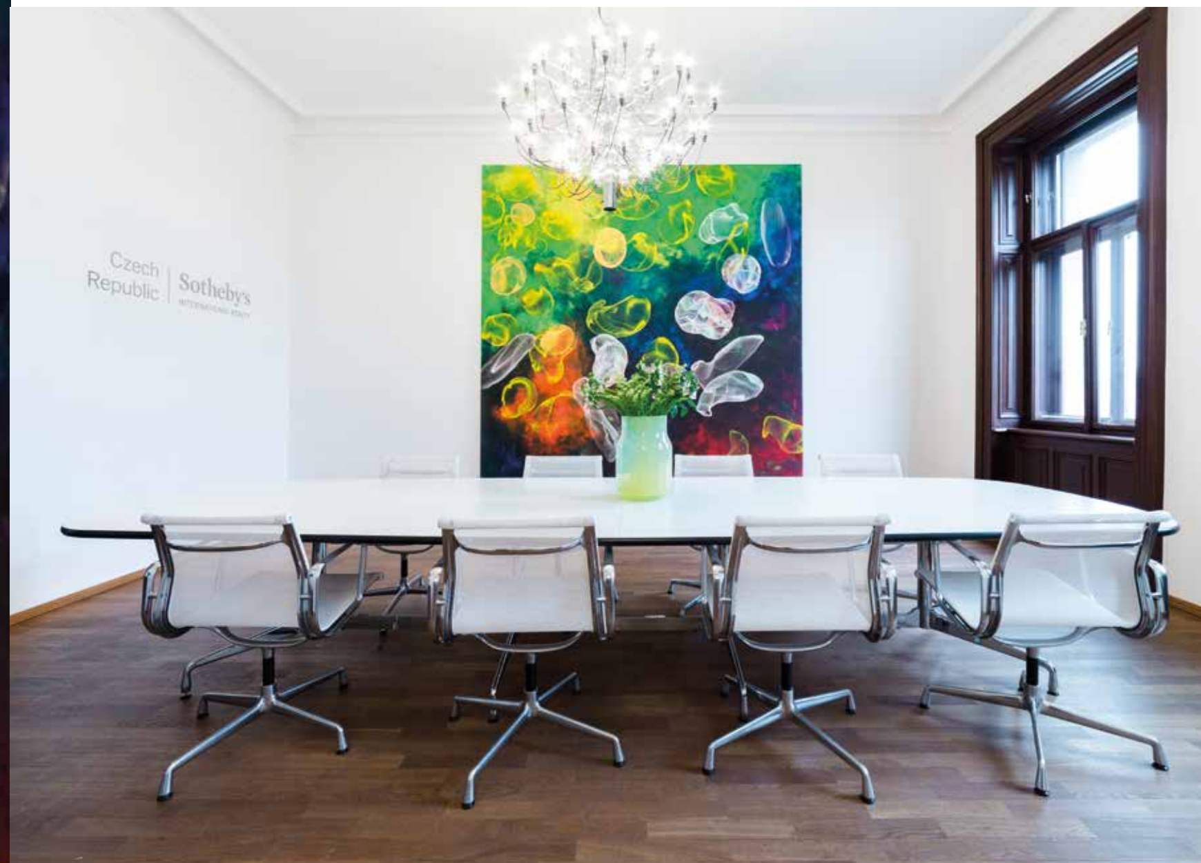
Zasedací místnosti vévodí „bubliny“ od Jiřího Georg Dokoupila.

JEN PÁR KROKŮ OD PRAŽSKÉ KAMPY, V HISTORICKÉM DOMĚ S VÝHLEDEM NA ŘEKU I NÁRODNÍ DIVADLO, SÍDLÍ ČESKÉ ZASTOUPENÍ SOTHEBY'S INTERNATIONAL REALTY. JMÉNO JÍ DAL SLAVNÝ LONDÝNSKÝ AUKČNÍ DŮM, A TAK NENÍ DIVU, ŽE MÁ BLÍZKO K UMĚNÍ. A ŽE NÁLADA V ZASEDACÍ MÍSTNOSTI V NIČEM NEPŘIPOMÍNÁ ŠKROBENOST REALITNÍCH KANCELÁŘÍ.