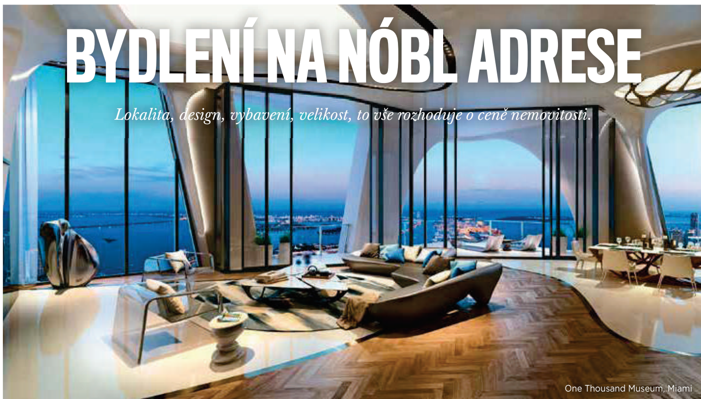
One Thousand Museum, Miami

Lokalita, design, vybavení, velikost, to vše rozhoduje o ceně nemovitosti.